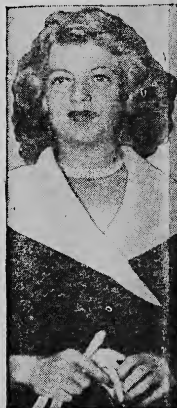
DE ROODHARIGE RITA HAY WORTH is in Honolulu gearriveerd om er gedurende een week te werken voor de film. Daarna zal zij enkele weken rust houden in verband met rugpijn.

RUIZ' SERVICENTER, Oranjestad ESSOVILLE SERVICE STATION, San Nicolas ESSO SERVICE STATION, San Nicolas LAGO COLONY SERVICE STATION